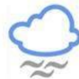
duō wù 多雾 foggy