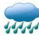
duō yǔ 多雨 rainy