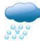
bīng báo 冰雹 haily