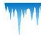
jié bīng 结冰 icy