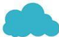
duō yún 多云 cloudy