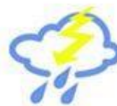
dǎ léi 打雷 thundering