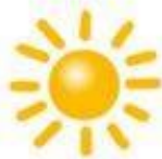
qíng tiān 晴天 sunny