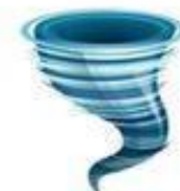
lóng juǎn fēng 龙卷风 tornado