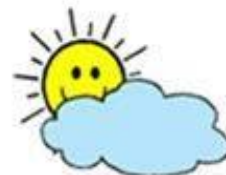
jú bù duō yún 局部多云 partly cloudy