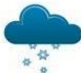
duō xuě 多雪 snowy