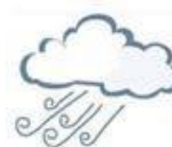
duō fēng 多风 windy