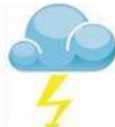
shǎn diàn 闪电 lightning