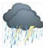
bào fēng yǔ 暴风雨 stormy